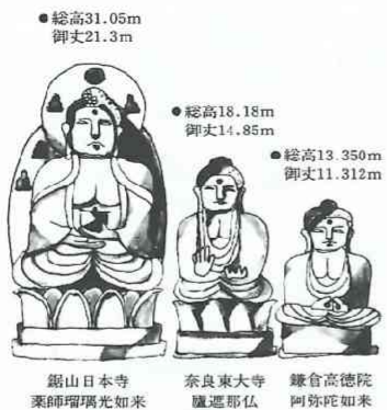
鋸山日本寺 薬師瑠璃光如来 奈良東大寺 盧遮那仏 鎌倉高德院 阿彌陀如来